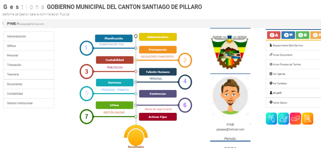
Figura: Pantalla principal de la Plataforma

Planificación Contabilidad Servicios G-Flow Talento Humano Administrativa Presupuesto Existencias Activos Fijos